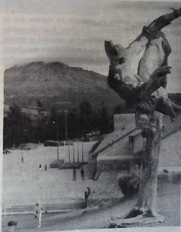
La danza/Raíces del Cielo

** Hago referencia al evento en que fue presentado este documento