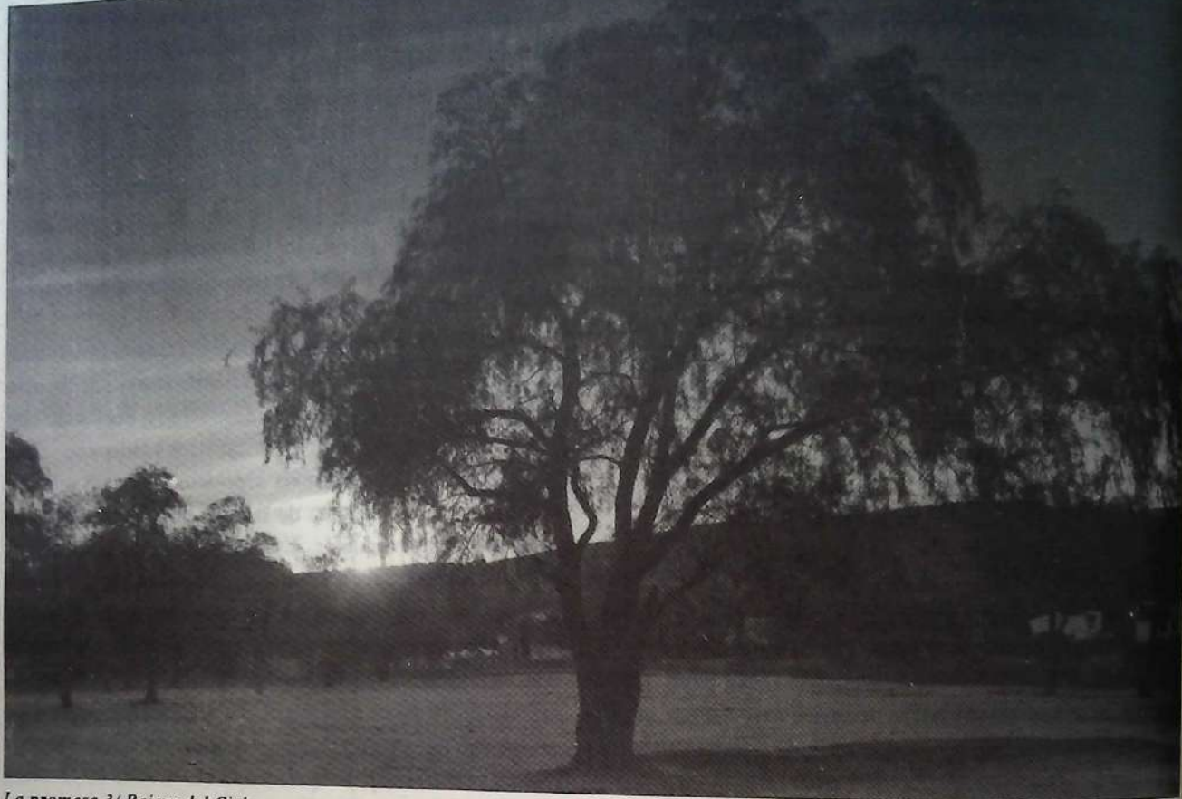
La promesa 3/ Raíces del Cielo

medio de la generalización del uso de textos, digestos, cuestionarios y los medios de informática y computación. Vencer inercias y resistencias del modelo adoptado hasta la fecha es condición para que nuestro crecimiento y desarrollo sea acorde a los postulados de la modernización educativa y a la puesta en marcha del TLC. La actitud del académico es, en el nuevo proyecto universitario, una actitud de cambio.