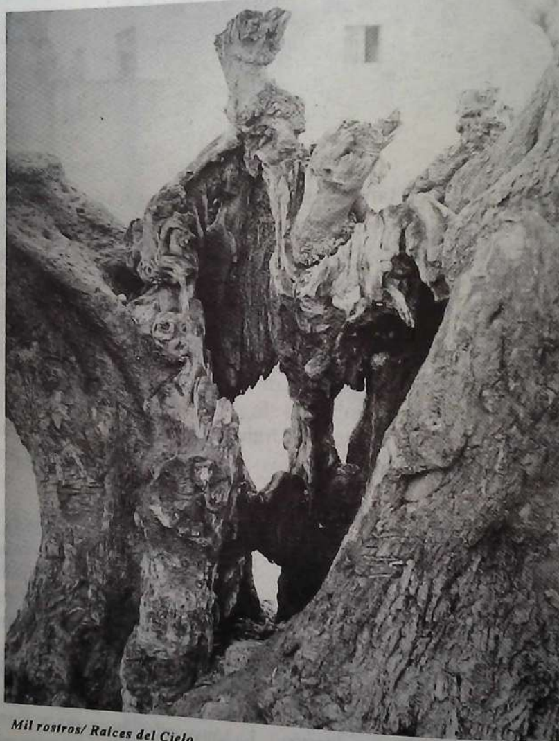
Mil rostros/ Raíces del Cielo

Es, desde luego, en el área académica donde se tienen los principales desafíos. La estructura académica, la vinculación entre docencia e investigación, tendencias de ingreso, seguimiento sistemático de egresados, opciones