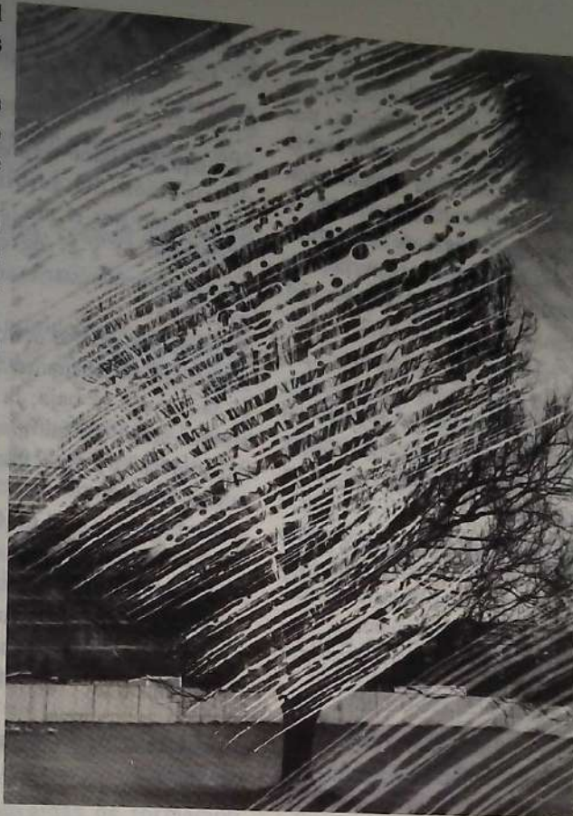
Raíces del cielo/Raíces del Cielo

Sus antecedentes se relacionan con la necesidad de atender a una creciente demanda de educación. Plantel que la discusión sobre la calidad se ha centrado en el trabajo pedagógico al interior del salón de clases planteándose medidas que no son suficientes ya que no se han acompañado de cambios en la organización y funcionamiento del salón de clases en relación al centro escolar. Se propone a la gestión escolar como el eje donde la organización de los factores y la administración, desde la administración pública hasta el plantel se articulan.