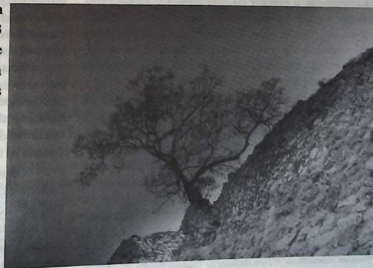
Casi en la cima/Raíces del cielo

Frente a tal estado de cosas, nuestro compromiso histórico es grande. Para terminar y aguisa de tiempo, la ANUIES nos informa que: E.U. ocupa el primer lugar de los países con los que México sostiene intercambios internacionales en materia educativa, con un total de 1993 acuerdos. En tanto que con Canadá sólo se acordaron 22 asuntos. Los convenios con E.U. se centraron en las ciencias sociales y administrativas; mientras que la ingeniería ocupó el primer lugar con respecto a Canadá. El informe estadístico también destaca que los objetivos de cooperación más requeridos fueron intercambios de profesor y estudiantes y, en menor grado, la investigación conjunta, técnicas de enseñanza y difusión de los resultados (6). Con estas tres líneas de reflexión,