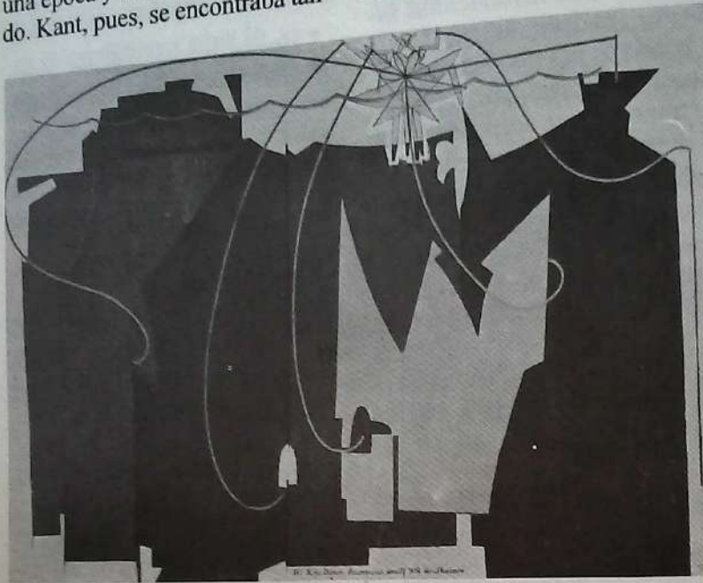
Man Ray "The rope dancer accompanies herself with her..."

un ejemplo. En el documento Reforma de la educación superior