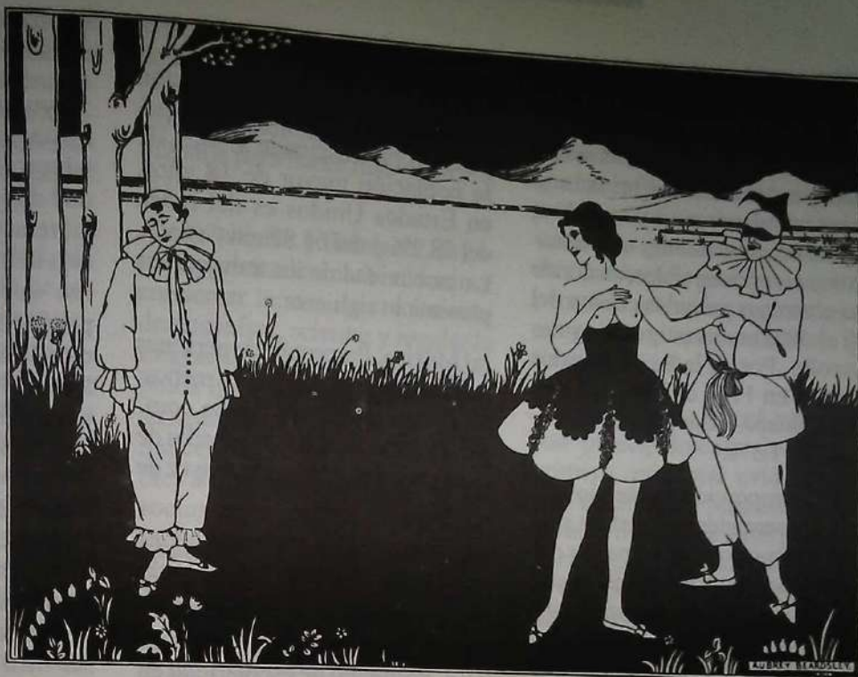
Aubrey Beardsley "The Coquette Pierrot". 1894.

20 en 1970 a 1 en 7 para 1985 (25) . El empeño si bien es significativo, es todavía exiguo; las cifras al respecto son ilustrativas. Un indicador muy utilizado en los análisis estadísticos que nos permiten aproximarnos a una realidad, es el Producto Interno Bruto. En educación, nuestro país asigna 5% del PIB, Estados Unidos el 6.8% y Canadá, 7.2%; si consideramos que la economía estadounidense es 27 veces mayor y la de Canadá 2.5 veces mayor que la de México, entonces las desproporciones adquieren un carácter más agresivo. Si agregamos que el gasto educativo per capita es de alrededor de 2 000 dólares en Estados Unidos y Canadá y en México de sólo 180 dólares; tenemos, entonces, que la situación de equilibrio inicial, en el plano